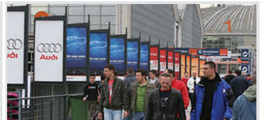
bilbord obostrani na pasareli 95x195 cm, papir 10.500 din/kom. kom.