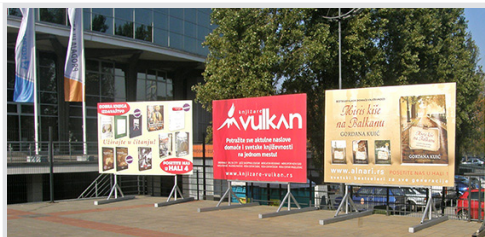
bilbord 300x200 cm, papir 24.000 din/kom. kom.