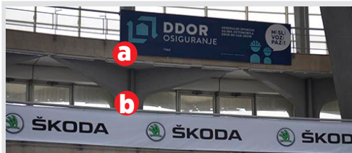
a) pano 6x1.5m kom. 17.000 din/kom. b) vinil na gelenderu iznad štanda kom. 3.150 din/m 2