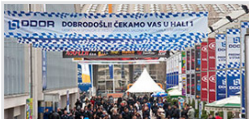
kolonada ispred hale 2, vinil 8x1 m sa 4 bilborda 95x195 cm 57.500 din/kom. kom.