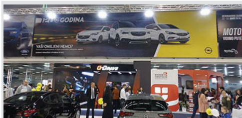
reklamna površina na vinilu, po m 2 3.150 din/m 2 m 2