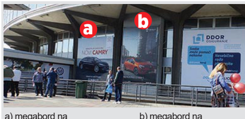
a) megabord na hali 1, 6x6, vinil kom. 160.000 din/kom. b) megabord na hali 1, 4x6, papir kom. 63.000 din/kom.