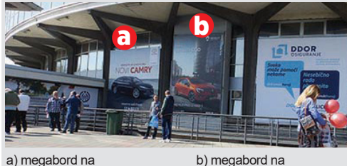
a) megabord na hali 1, 6x6, vinil kom. 160.000 din/kom. b) megabord na hali 1, 4x6, papir kom. 63.000 din/kom.