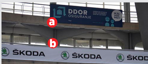
a) pano 6x1.5m kom. 17.000 din/kom. b) vinil na gelenderu iznad štanda kom. 3.150 din/m 2