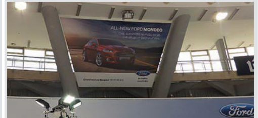
megabord u hali 1, V-baner, vinil, 735x427 cm kom. 99.000 din/kom.