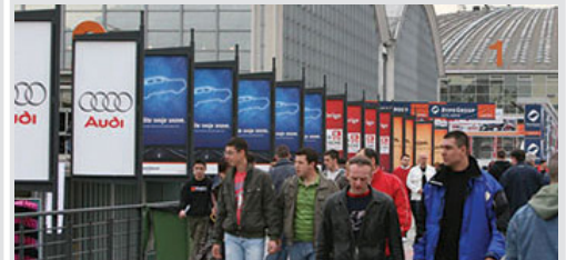
billbord obostrani na pasareli 95x195 cm, papir kom. 10.500 din/kom.