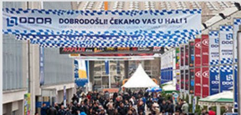
kolonada ispred hale 2, vinil 8x1 m sa 4 billboarda 95x195 cm kom. 57.500 din/kom.