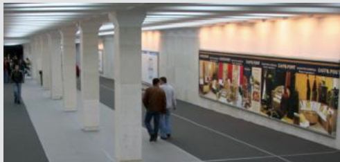
megabord, podzemni prolaz 995x195 cm, papir, osvetljen kom. 51.150 din/kom.