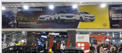
reklamna površina na vinilu, po m 2 kom. 3.150 din/m 2