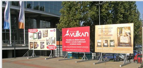
billbord 300x200 cm, papir kom. 24.000 din/kom.