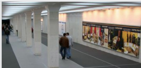
megabord, podzemni prolaz 995x195 cm, papir, osvetljen kom. 51.150 din/kom.