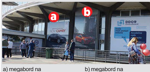
a) megabord na hali 1, 6x6, vinil kom. 160.000 din/kom. b) megabord na hali 1, 4x6, papir kom. 63.000 din/kom.