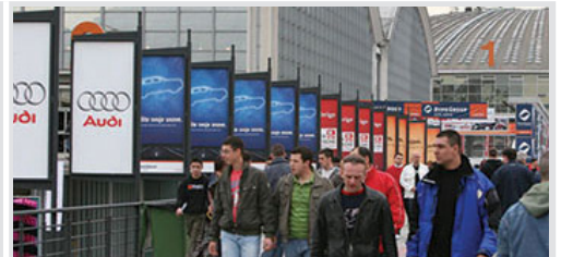
bilbord obostrani na pasareli 95x195 cm, papir kom. 10.500 din/kom.