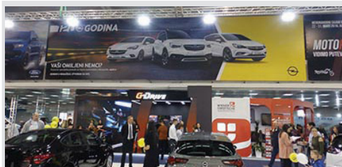
reklamna površina na vinilu, po m 2 m 2 3.150 din/m 2