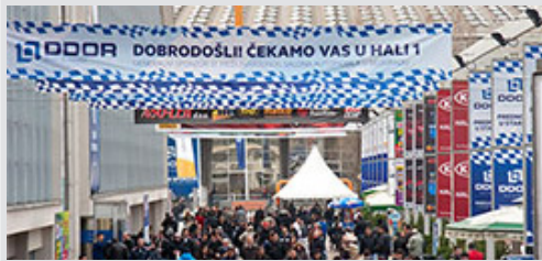
kolonada ispred hale 2, vinil 8x1 m sa 4 bilborda 95x195 cm kom. 57.500 din/kom.