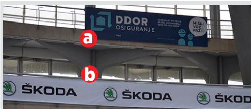
a) pano 6x1.5m kom. 17.000 din/kom. b) vinil na gelenderu iznad štanda kom. 3.150 din/m 2